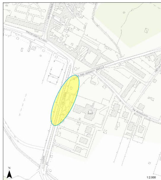
Stralcio Mappa CTR